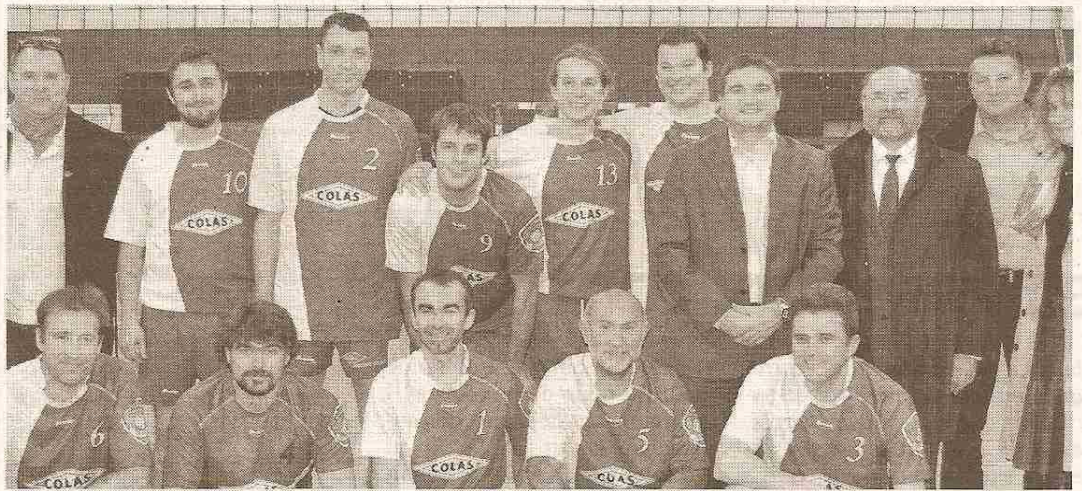
L'équipe de volley Bonneuil-Vouneuil.

L'équipe de volley Bonneuil-Vouneuil, après une saison 2010-2011 extraordinaire qui lui a permis de remporter le championnat et la coupe de la Vienne, découvre cette saison la première division. La compétition est très serrée avec des clubs de niveau très homogène et le club vise modestement le maintien. Les joueurs ont retrouvé les résultats en dents de scie, les victoires plus rares, les défaites amères qui poussent chacun à se dépasser. Le club a aussi engagé une équipe en championnat 4 x 4. Cette nouvelle pratique attire de plus en plus de joueurs à la recherche d'un jeu plus dynamique (filet moins haut, rotation plus rapide, mixité possible) et moins onéreux, privilégiant la convivia-