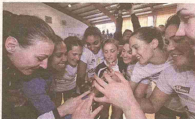
Les Poitevines ont livré une dernière prestation solide mais échouent de peu pour l'accession à l'étage supérieur.