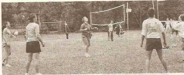
L'entraînement des volleyeurs avant le début des tournois.

La première année d'existence n'est pas encore achevée et l'Usma volley-ball compte déjà une quarantaine de licenciés, alors même qu'il ne lui a pas été possible de former une équipe de jeunes faute de créneaux horaires disponibles. La vitalité de ce tout jeune club qui aligne 2 équipes masculines et 2 équipes « loisirs » se manifeste également avec l'organisation de son premier tournoi amical, ouvert à tous les clubs du département et à tous les joueurs à partir de 16 ans, dimanche dernier. Toute la journée de samedi, sous un soleil de plomb,