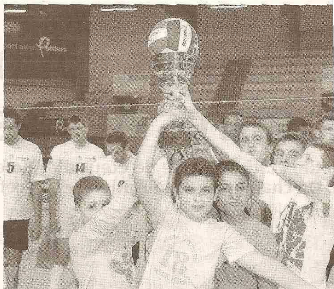
Les jeunes champions de l'équipe gagnante présentent fièrement leur coupe.

Les futurs champions ont eu la possibilité de parler aux joueurs professionnels, de les interroger sur leur parcours sportif et de solliciter une didac-