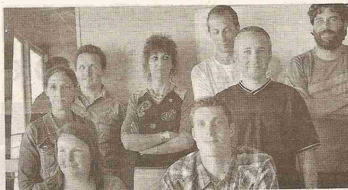
Les membres du bureau ne manquent pas d'enthousiasme.