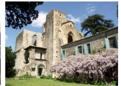
Abbaye de Villelongue