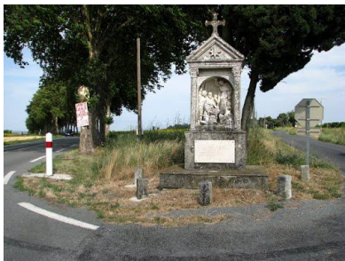
Calvaire près d'Arzens