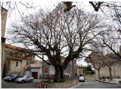
Orme de Sully à Villesèquelande