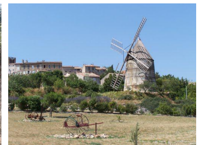
Le moulin de Villasavary