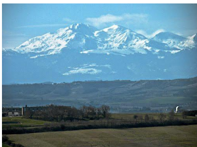
Les Pyrénées vues depuis Villespy

VILLASAVARY : L'église Saint Pierre. L'église Saint Jacques. Chapelle Saint-Martin-de-la-Salle de Besplas. Château primitif. Château de La Nogarède, édifié au XVIII e siècle, résidence de la famille de Lamée de Soulages. Halles municipales. Monuments aux morts. Moulin à vent. Éolienne ascenseur d'eau. Voûte du ruisseau des Canonges. Rues des anciennes portes. Rue de l'Asile.