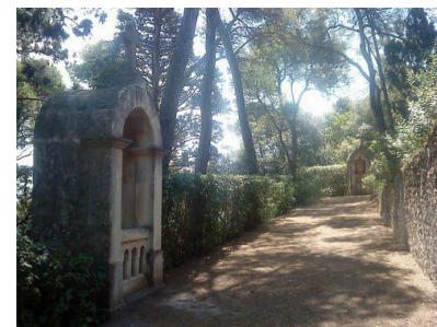
Calvaire de Laurabuc