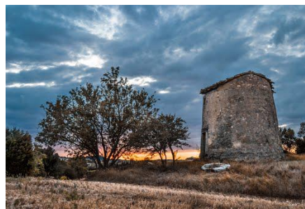
Moulin de la pierre Saint Martin Lalande