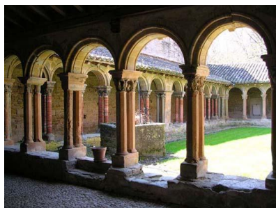
Abbaye de Saint Papoul