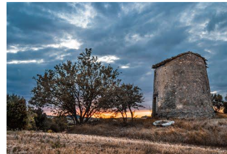
Moulin de la Pierre Saint Martin Lalande