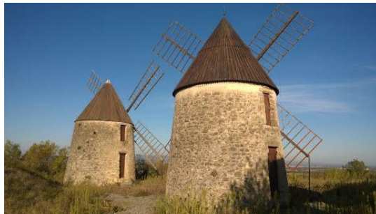
Les 2 moulins de Laffon Le Mas Saintes Puelles