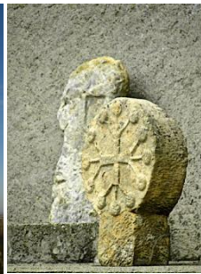
Pierre discoïdale Airoux