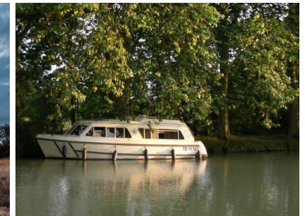
Canal du Midi Villepinte