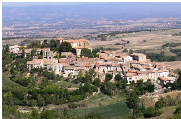
Vue sur Laurac le Grand depuis la Pierre Levée