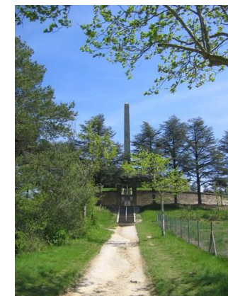
Obélisque de Riquet Seuil de Naurouze