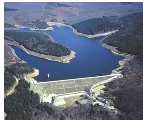
Barrage de la Ganguise