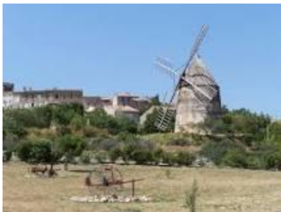
Moulin de Villasavary

MONTFERRAND : Vestiges archéologiques de Montferrand. Croix discoïdale de Montferrand. Église Saint-Pierre d'Alzonne