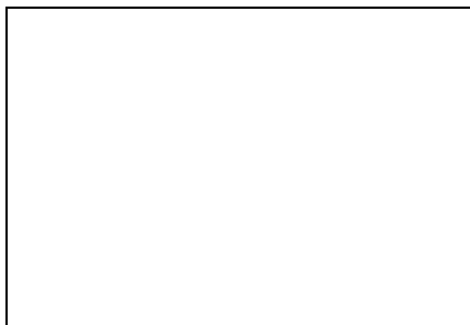
Cachet du médecin