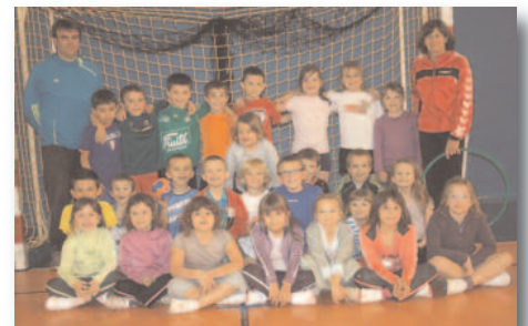
Ecole de hand

Nouvelle équipe en féminine au club : la 3 est composée de mamans, d'anciennes et de nouvelles, une vraie équipe « esprit loisir » même si les anciennes aiment toujours autant gagner. Ce qui donne des matchs très intéressants à voir et d'un bon niveau. D'ailleurs les filles ont tenu, face au leader, pendant une heure pour ne s'incliner que d'1 but. Avec 3 victoires et 4 défaites elles occupent le milieu de tableau.