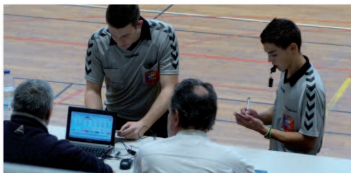
Table de Marque : Feuille de match et feuille de table électronique

Astuce : Pour afficher la feuille de table électronique lorsque la feuille de match est ouverte, cliquer sur « résultats » puis cliquer sur alt et T en même temps.