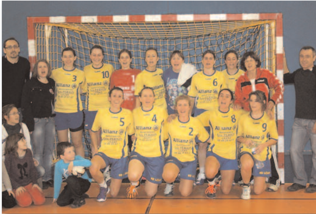
Séniors filles 1

Les joueurs sont une fois de plus en région et... une fois de plus c'est dur ! L'objectif du club était de former les -18 région de la saison dernière, au jeu senior au sein de cette équipe 2. Malheureusement, le départ de nombreux - 18 (en 1 o ou parce qu'ils se sont arrêtés), a fait évoluer le projet du club et l'équipe 2 évolue encore avec