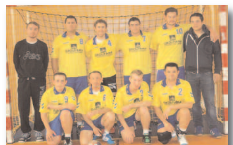
Séniors gars 3