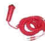
Doublage* arrivée manuelle

* IMPORTANT : Lors de l'utilisation d'un système automatique et semi-automatique, il est souhaitable que doubler par un chronométrage manuel.