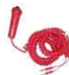
Poire d'Arrivée Manuelle