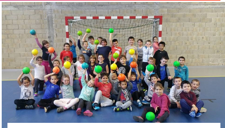
Le club vient de recevoir 19 ballons pour son label argent de l'école de hand.