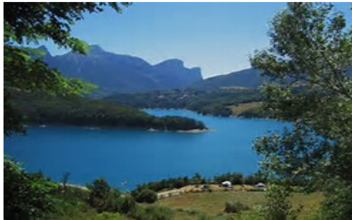
Lac du Sautet