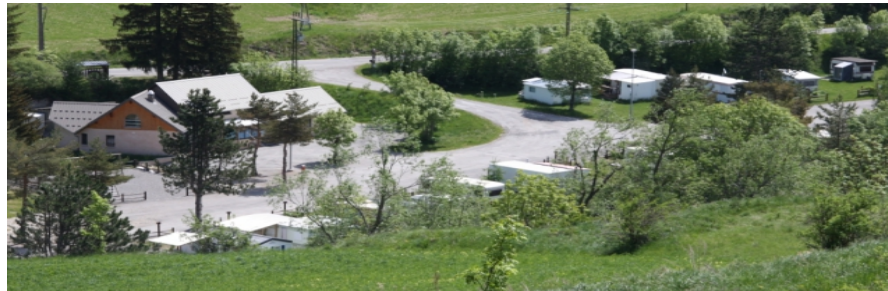
Camping des Auches

Le camping est calme et familial. Le camping est à proximité de la nature. L'altitude de Saint etienne en Devoluy est de 1400m