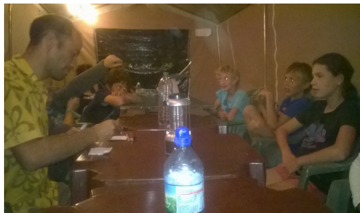
Les enfants en plein jeu du loup garou...

Sens de la stratégie, observation, patience, malice, jouer un rôle, être créatif, s'amuser