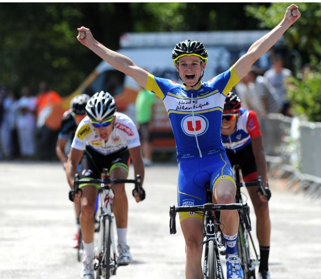
en franchissant en vainqueur la ligne d'arrivée à Montalieu.