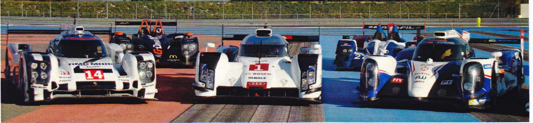
PORSCHE (14 & 20)