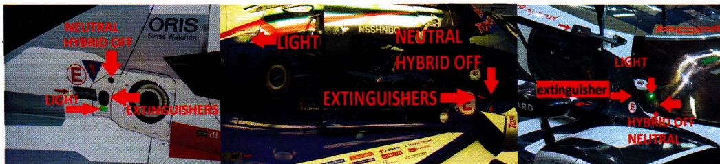
AUDI (1 & 2 & 3)