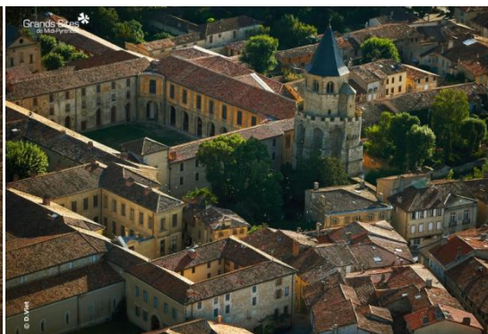
Abbaye de Sorèze