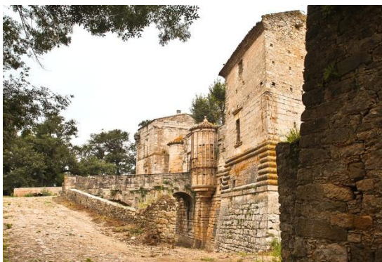
Château de Ferrals XVI siècle