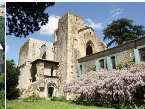
Abbaye de Villelongue