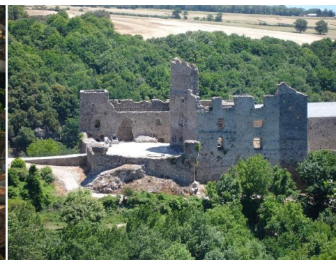
Château de Saissac