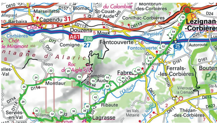
Openrunner N° 6208027