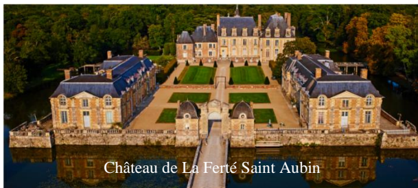
Château de La Ferté Saint Aubin