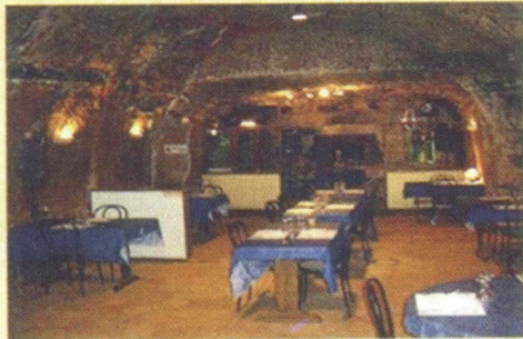
1 ère cave - capacité 60 personnes

Jacky et Isabelle ORGEUR Vous accueillent dans leurs Deux caves restaurant