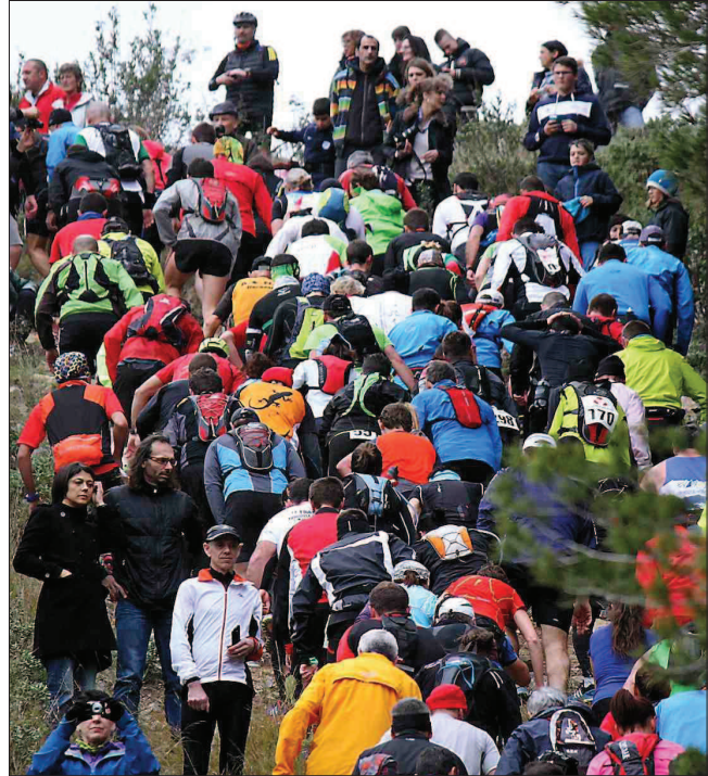
► L'impressionnante côte du réservoir sélective et « casse-pattes » !