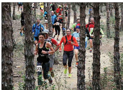
A travers bois, le cortège de concurrents et concurrents.