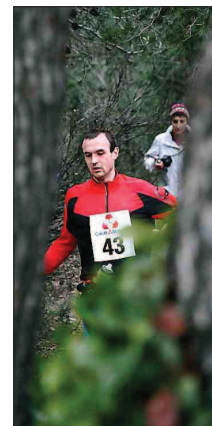
Une course nature!