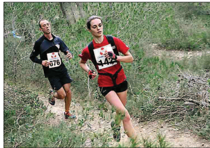
► Belles foulées à deux pour une course exigeante.