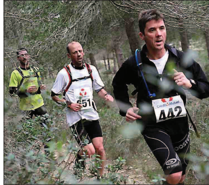
► Un passage en plein massif.