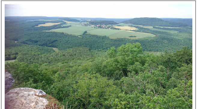
Vue de la Roche POMPON

C'est parti pour la 2ème partie, descente vers le Leuzeu pour un possible ravitaillement en eau. Nous y trouvons des photographes amateurs chevronnés qui réalisent pour leur propre compte des 'macros' de plantes, d'insectes. Brève halte, nous poursuivons en direction de Corcelles les monts en passant par le col de la Maille et la combe de Notre Dame d'Etang.