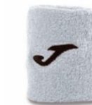
SERRE POIGNET D'ABSORPTION