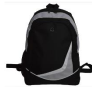
SAC A DOS 25L