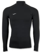
HAUT THERMIQUE COMPRESSIF