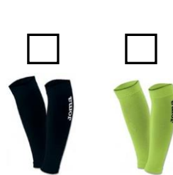
CHAUSSETTE DE COMPRESSION