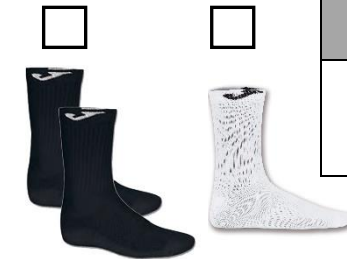
CHAUSSETTES 17 CM