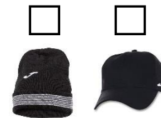
BONNET ET CASQUETTE